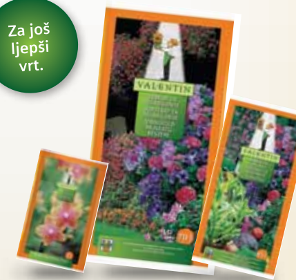
Valentin zemlja za orhideje 5 l, Valentin zemlja za pelargonije 70 l i Valentin zemlja za lončanice 45 l