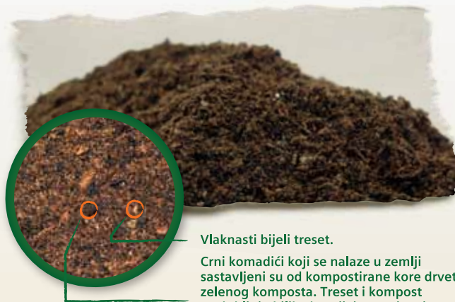
Vlaknasti bijeli treset.

Valentin zemlja sadrži kvalitetan i lagano razgrađen vlaknasti bijeli treset smeđe boje koji joj daje prozirnost i rahlost. Ne sadrži mnogo crnog