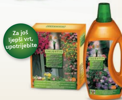
Valentin gnojivo s dugotrajnim djelovanjem za balkonske biljke (1 kg), Valentin gnojivo za cvjetajuće biljke (1 l)

Pazite da su dalije udaljene od vrućih zidova te im omogućite da oko njih nesmetano kruži zrak. Biljke će biti zdravije i čvršće, te će Vas razveseljavati zdravim i šarenim cvjetovima.